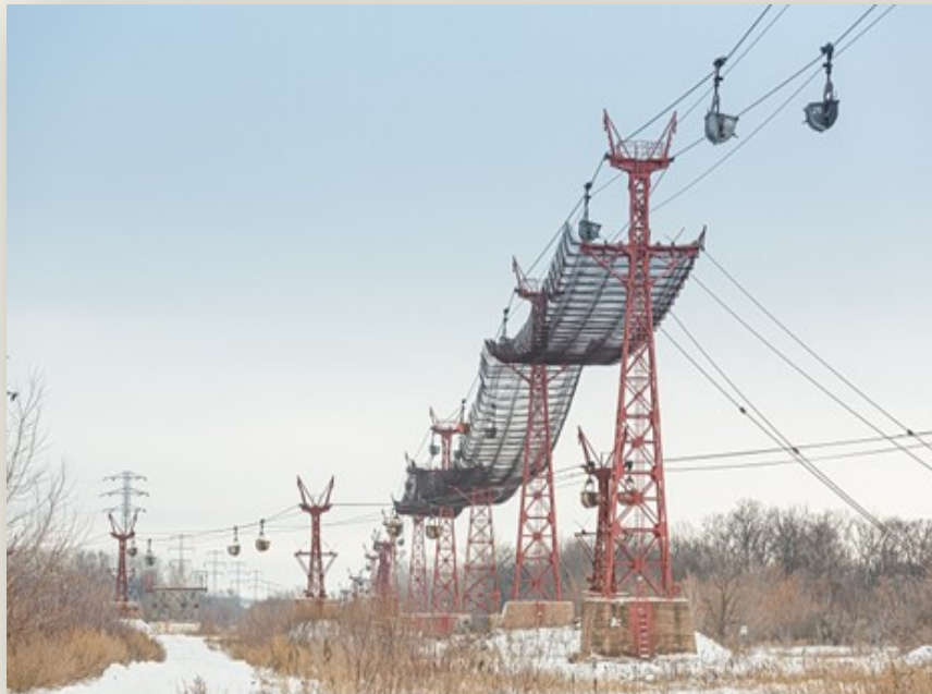
Защитный мост канатной дороги