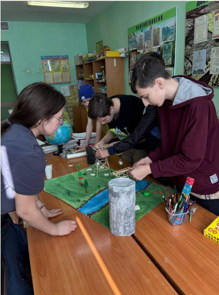
Сборка составных частей