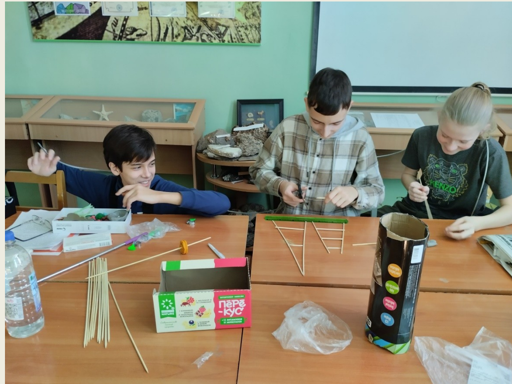
Изготовление опорных столбов для каната