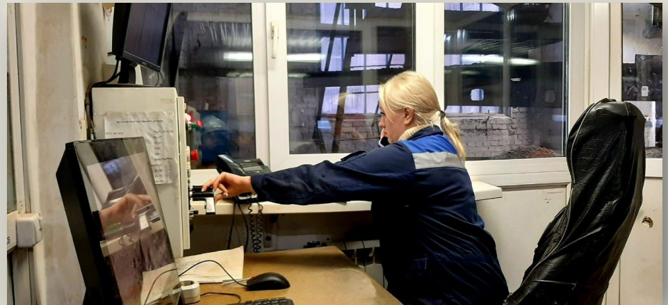
Оператор пульта управления

Это пульт управления канатной дорогой на заводе