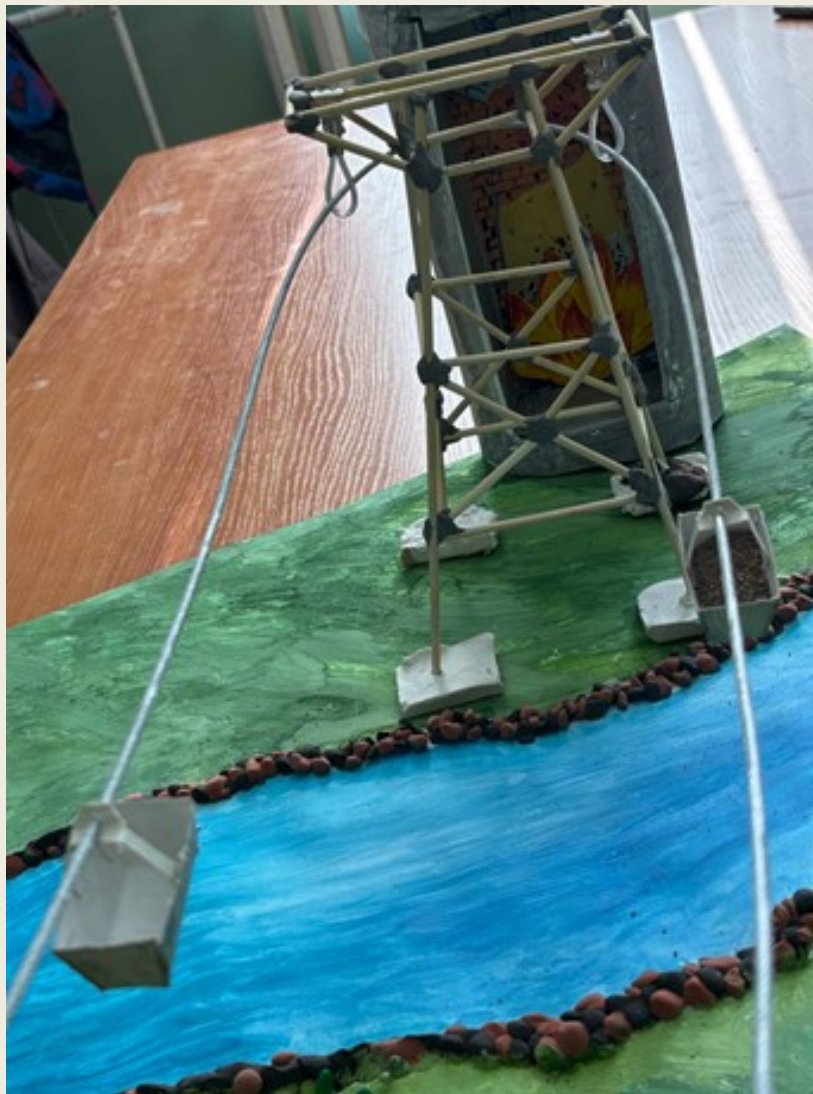
Канатная дорога с вагонетками