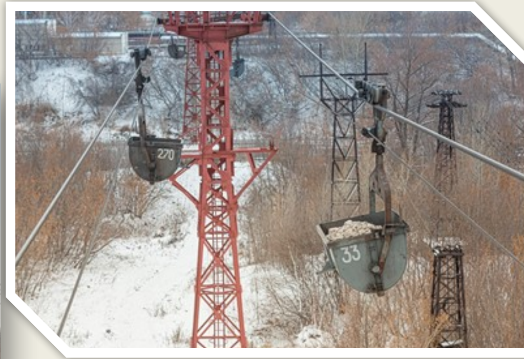
Дорога кольцевого типа: левая сторона – порожняя, правая - груженная