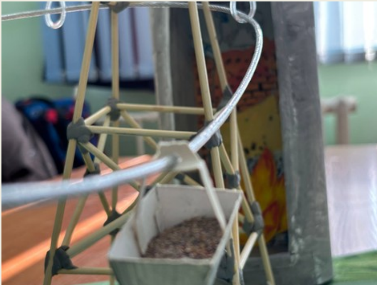
Вагонетка, несущая известняк в печи